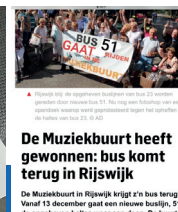
De Muziekbuilt heeft gewonnen: bus komt terug in Rijswijk

De Muziekbuilt in Rijswijk krijgt 'n bus terug. Vanaf 13 december gaat een nieuwe buslijn, 51, de opgeheven haltes weer aan doen. De buurt